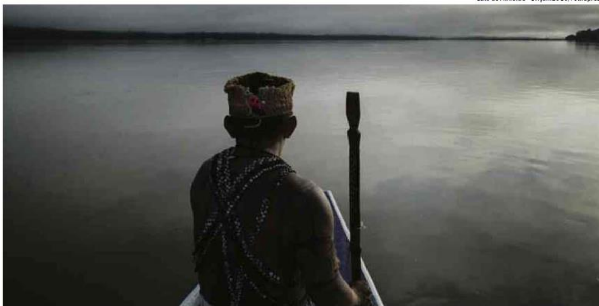
Índio munduruku navega pelo rio Tapajós; usina na região teve licenciamento suspenso em 2016 por atingir área demarcada