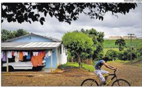
MENINA PASSEIRA de bicicleta no bairro de Alto Alegre, em Catanduvas: divisa com prisão federal (ao fundo)

BOA CHANCE Teste o seu perfil nas redes sociais é interpretado.