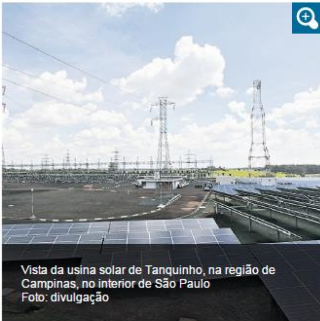
Vista da usina solar de Tanquinho, na região de Campinas, no interior de São Paulo

Especialistas do mercado de energias renováveis esperam movimento de consolidação diante das dificuldades de crescimento nos próximos anos